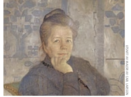
UTSITT AV MALEBY AV CARL LINSSON

«Kultur er det som blir igjen når man har glemmt alt det man har lært.»