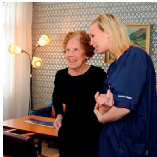
Innvielse av ny 60-tallsstue.

På et sykehjem vil, og skal det være, fokus på alle behov som skal dekkes; Både fysiske, psykiske, men også sosiale og åndelige behov.