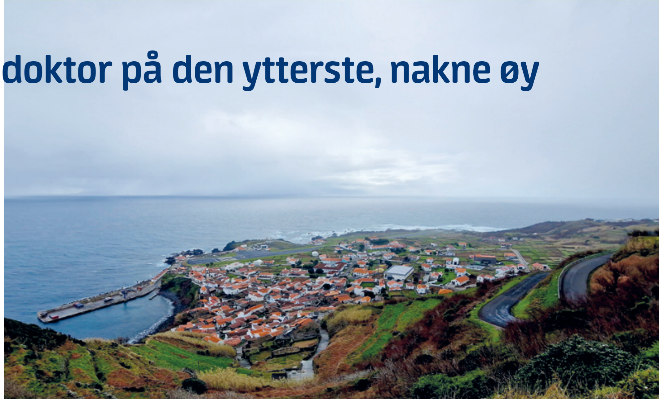
Vila do Corvo, en fem hundre år gammel by midt i Atlanter, med verdens beste helsesenter.

Som gammel distriktslege i Finnmark tenkte jeg det ville være artig å se om det sto til liv for kollegaene i den andre enden av verdensdelen. Portugal er jo kjent for framragende rusomsorg og godt primærhelsevesen. Er de like gode i distriktsmedisin? Jeg dro til øya Corvo i Azorene, der Europa begynner i sørvest. I posisjon like opp mot Biscaya tar Corvo imot det Atlanter'n har å by på av vær. Øya tar ned en Dash hver annen dag, men nordvesten er brutal, og flyplassen er oftere stengt enn åpen. Det er bare en eneste bosetting på øya, den gamle byen Vila do Corvo på lavasletta i sørenden. Her bor det 434 mennesker, resten av øya er fribeite for kyr og sau. Kunstgjødsling og sprøytemidler er forbudt.